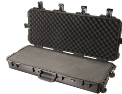
iM3100-X0001 With Foam