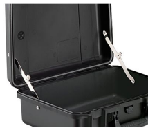
iM-LIDSTAY Soporte de tapa