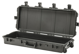
iM3100-X0000 No Foam