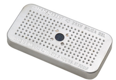
1500D El gel de sílice desecante Peli